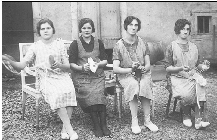
Golondrinas roncalesas en Maule, hacia los años 20.

Por otra parte está la importancia del relato (Simonovis, 2011), y el interés de contarlo del lado de sus protagonistas 5 . Michel Trouillot (1995, 2011) antropólogo haitiano y profesor de la Universidad de Chicago escribe además: "Necesitamos historias que ningún libro de historia puede contar; pero no están en las aulas, y menos aún en una clase de historia. Están en las lecciones que aprendemos en casa, en la poesía y los juegos infantiles, en lo que queda de la historia cuando cerramos los libros de historia con sus hechos comprobables" (op. cit.:352-353).