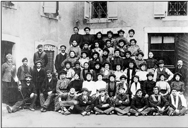
Grupo de emigrantes españoles en uno de los barrios obreros de Maule, a principios del siglo XX.

Aquella emigración circular de las mujeres navarras y aragonesas a Francia, y al continente americano, acabó generando una comunidad en la diáspora, de carácter transnacional.