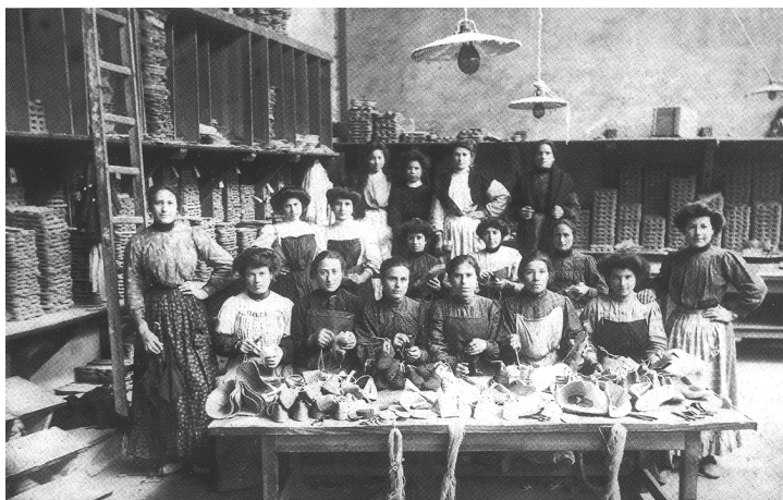
Golondrinas navarroaragonesas en una fábrica de algaratas de Maule, a principios del siglo XX .