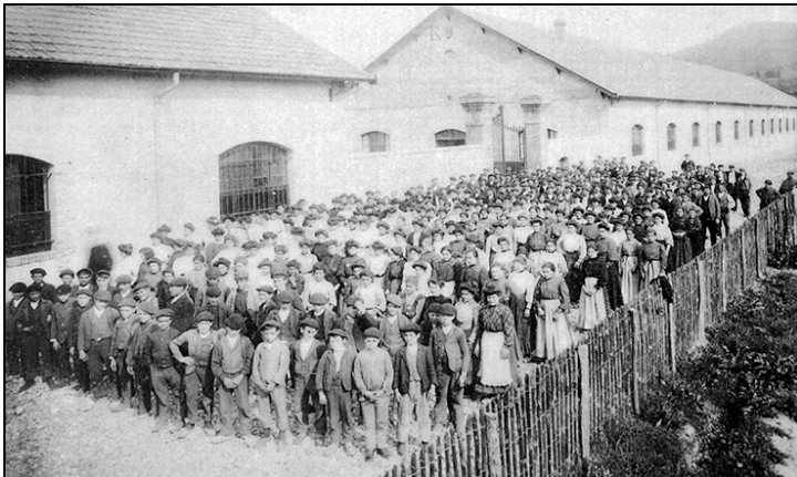
Plantilla de la fábrica de alpargatas Béguerie, a principios del siglo XX.

Si se compara con otras migraciones de España a Francia (por ejemplo, la relacionada con el exilio posterior a la guerra civil española a la inmigración económica de los años 50-60), la migración de las golondrinas navarroaragonesas resulta cuantitativamente poco relevante. En los momentos de mayor afluencia, no suponía más allá de 2000 personas al año. Sin embargo, me parece importante estudiar este movimiento migratorio por varios motivos.